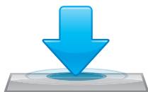
RECURSO DE TARA PREDETERMINADA

Proporciona maior mobilidade das balanças dentro da loja e menor congestionamento no local da instalação, em virtude da eliminação dos cabos e eletrodutos. Maior segurança e velocidade de comunicação. Compatível com dispositivos 802.11b/g, prevê autenticação WEP e WPA-PSK ou WPA2-PSK AES.