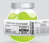
Exemplo de aplicação