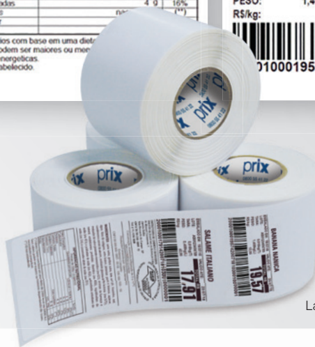
Layouts de etiquetas ilustrativos.