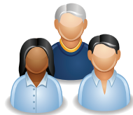
CONTROLE DE VENDAS POR OPERADOR

Permite que até 20.000 valores de tara (peso da embalagem) utilizados pela sua loja, sejam predeterminados e associados diretamente a cada um dos 20.000 itens cadastrados na 6i.