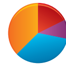
ACUMULADOR DE VENDAS (GERAL E POR ITEM)

Permite cadastrar diretamente na balança até 500 operadores, promovendo total controle e registro das transações, peso, quantidade e valor das vendas acumulada por operador.